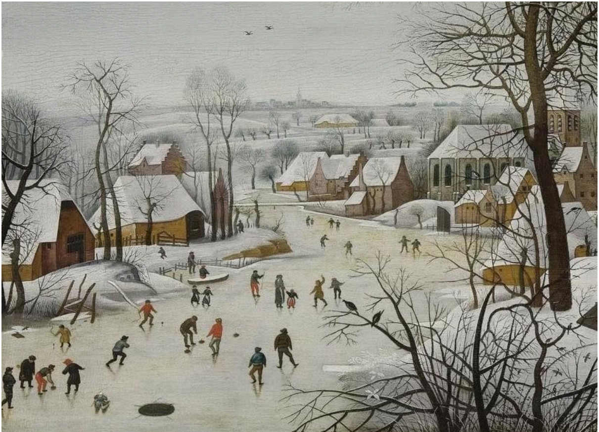
Pieter Bruegel le Jeune, Paysage d'hiver.