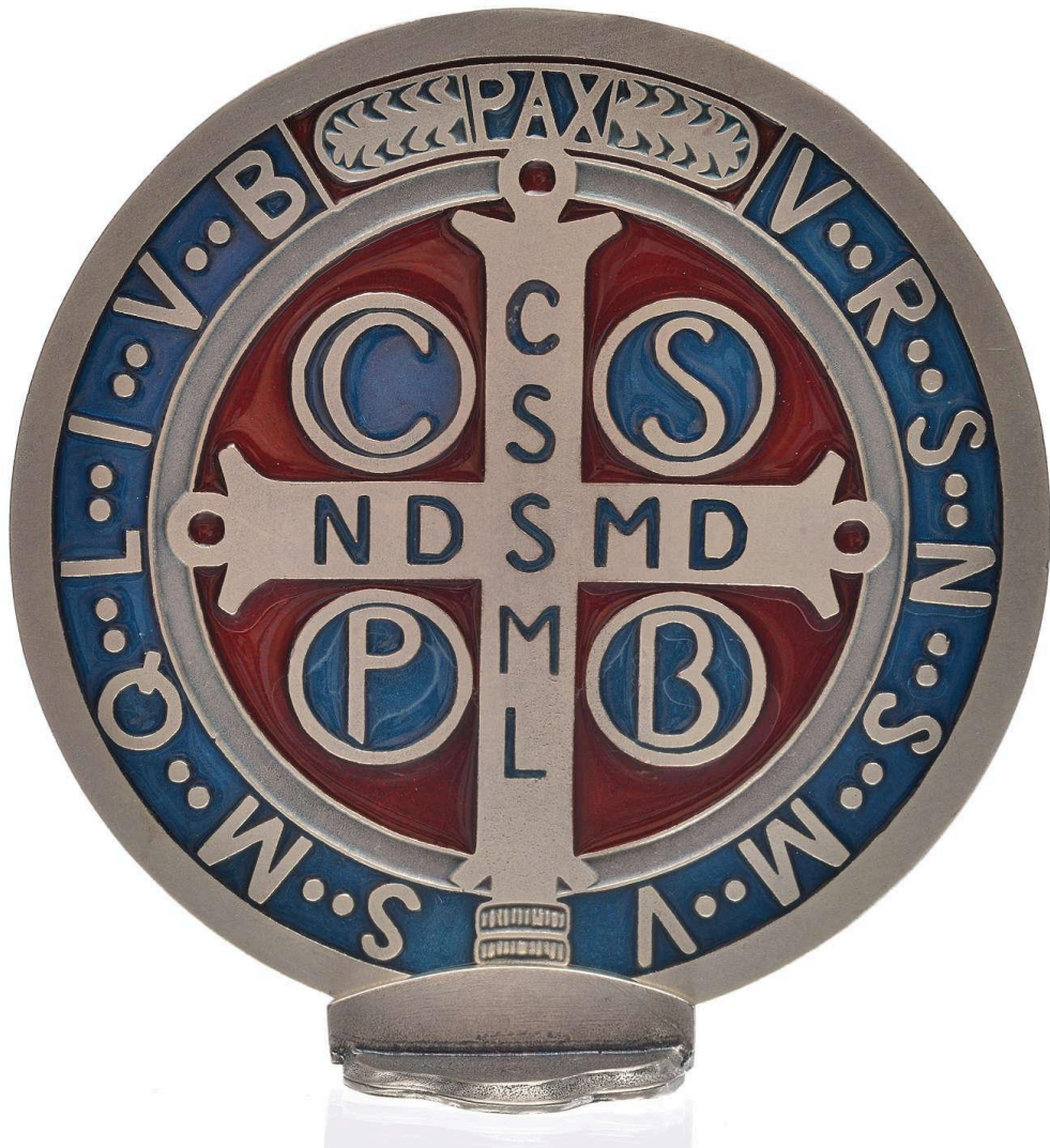
Médaille de st. Benoît - ( https://www.holyart.fr/articles-religieux/ )