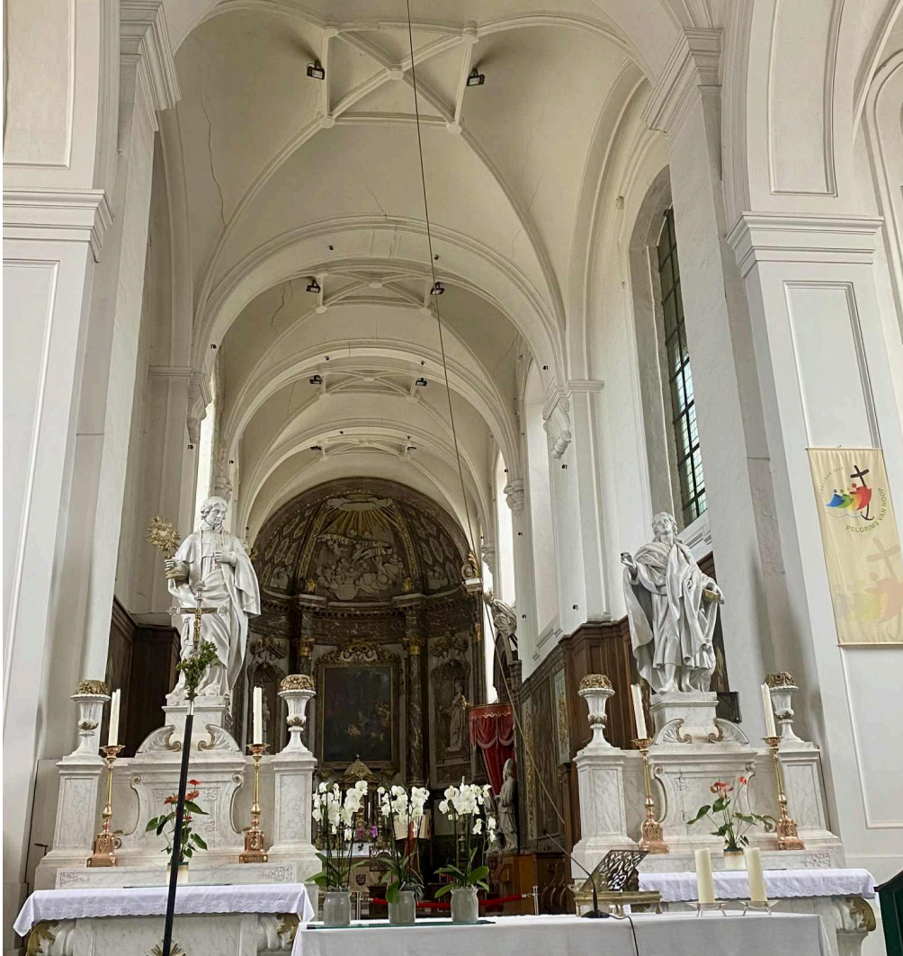
Abdy van Park.

Charles de Thibault - www.bleu2.eu - février 2026.