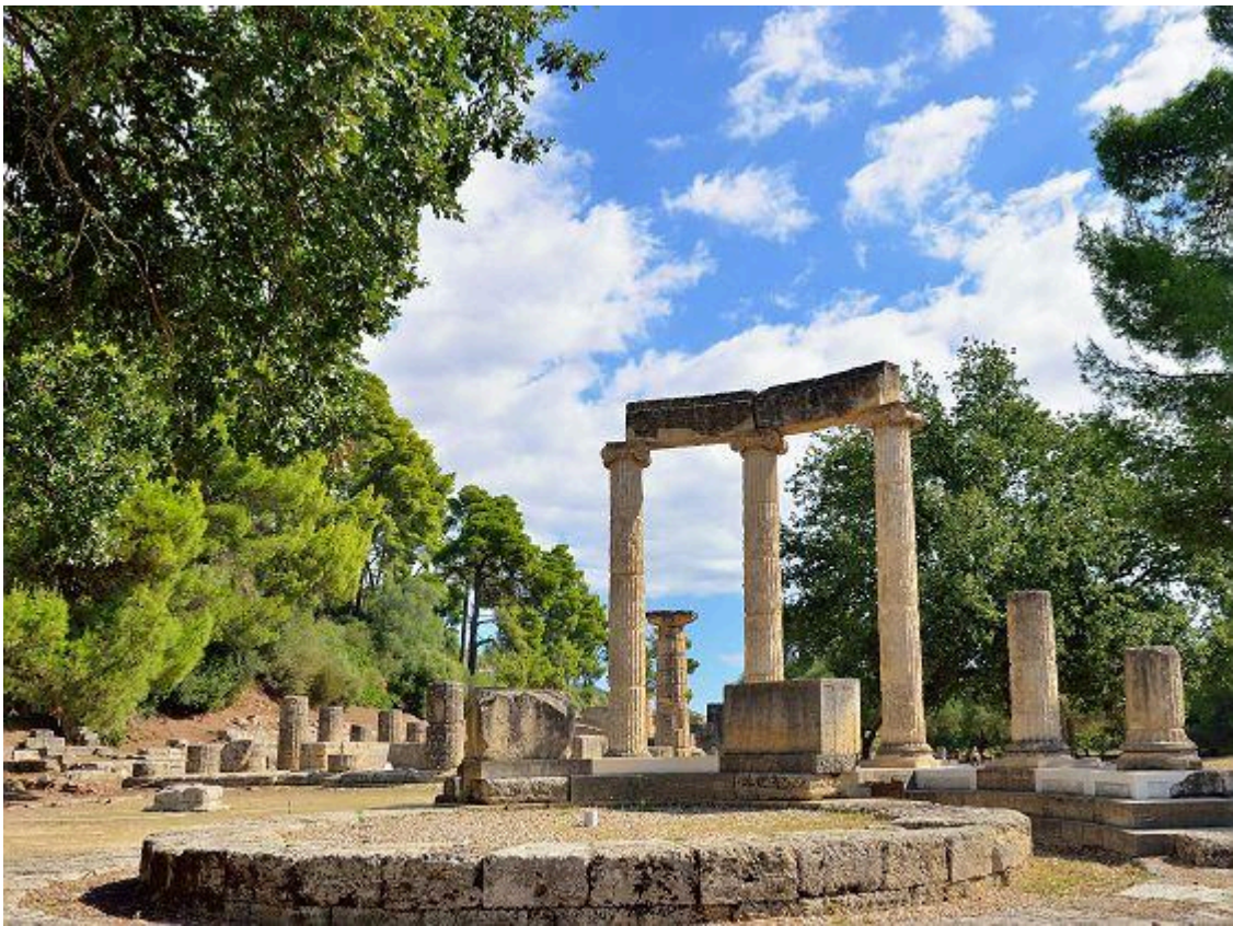
Autel, dans le site archéologique d'Olympie.